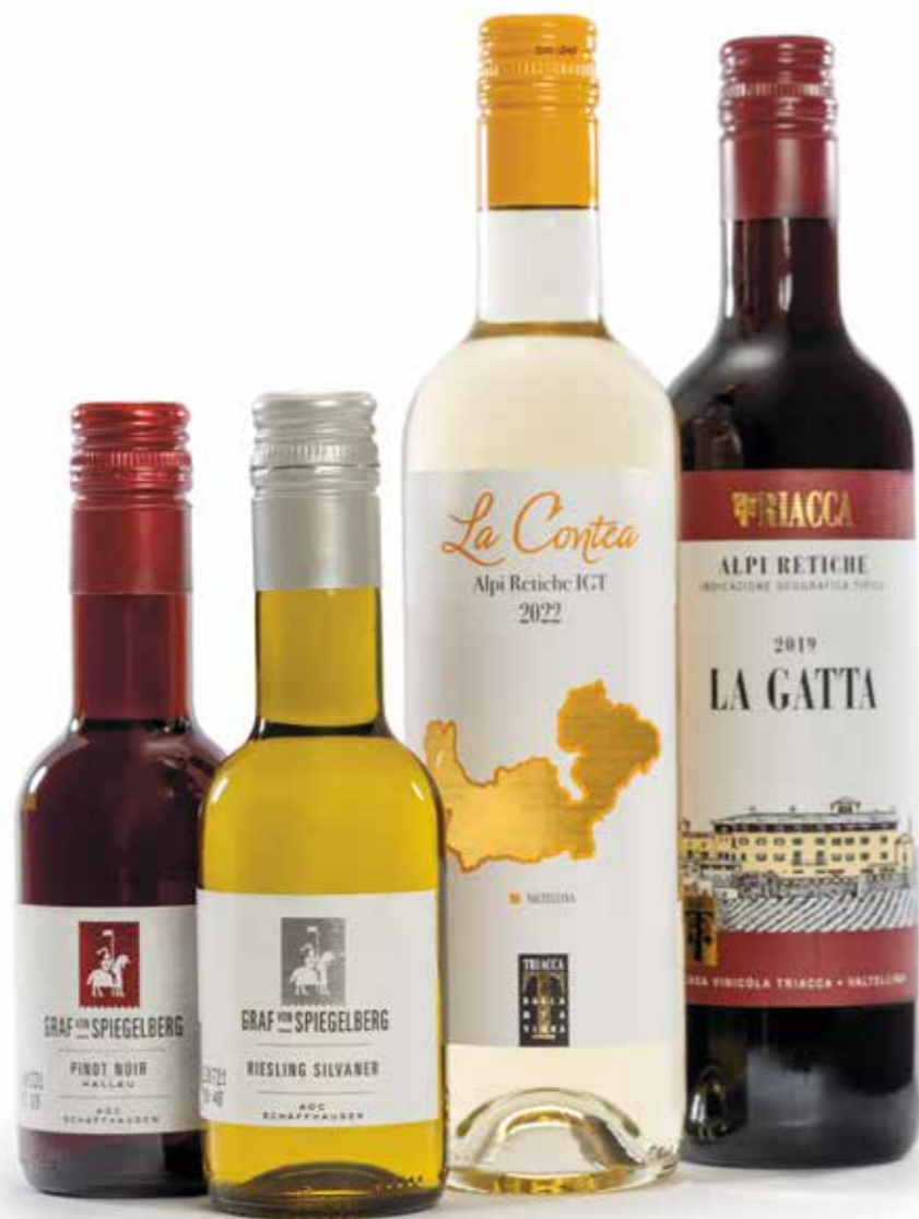
Weinauswahl / Selezione di vini / Wine selection