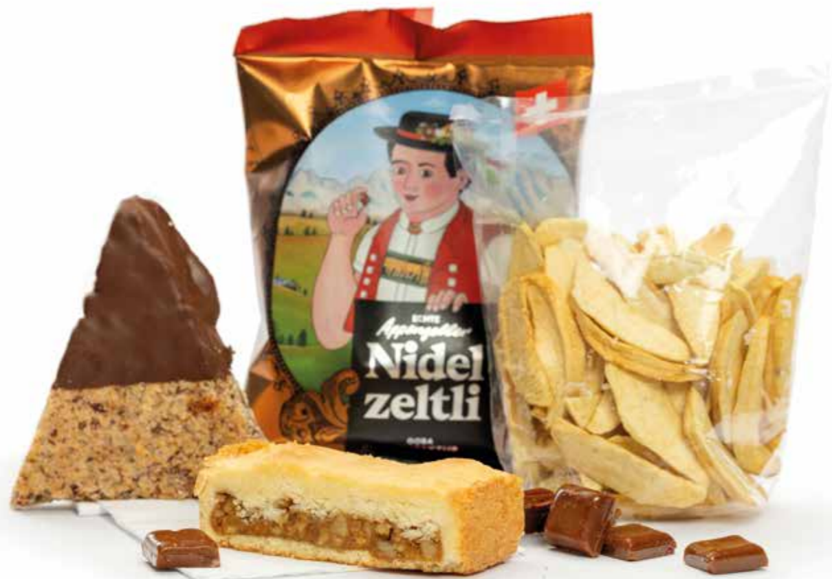
Naschereinauswahl / Selezione di dolci / Selection of sweets