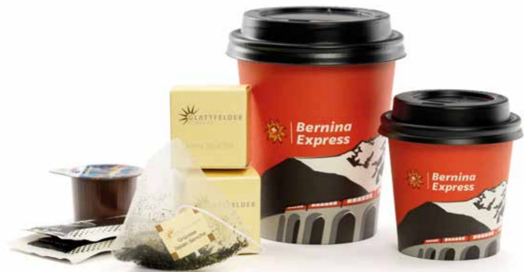
Heisse Getränkeauswahl / Selezione di bevande calde / Selection of hot drinks