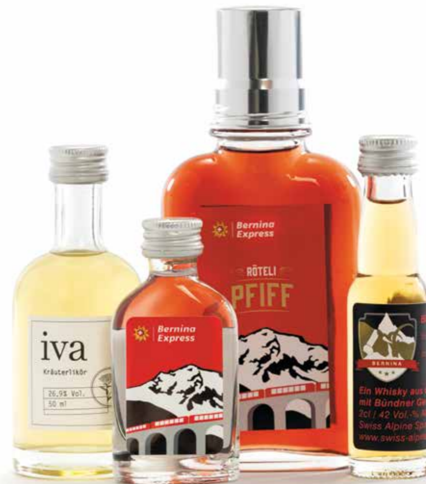
Spirituosenauswahl / Selezione di liquori / Selection of spirits